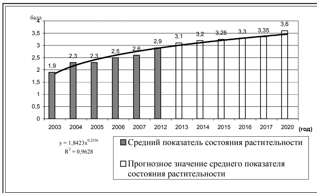
Рис. 2. Динамика экологического состояния городской растительности

способствует возникновению сухобочин, морозных трещин, проростей и дупел. Морозными трещинами при этом особенно сильно повреждены стволы тополя душистого – 11 %, березы плосколистной (ул. Парковая, Широкая, район ДСМ) – 8 % обследованных деревьев. Типичными повреждениями стволов ивы Шверина, кроме вышеназванных, являются гнили (27 % деревьев ивы). К основным повреждениям корней относится их обнажение. Распространенность этого явления у обследованных видов изменяется от 5 % у ивы любого вида до 30 % у тополя душистого. Вторыми по частоте встречаемости являются механические повреждения, составляющие от 4 % у черемухи и до 7 % у тополя душистого.