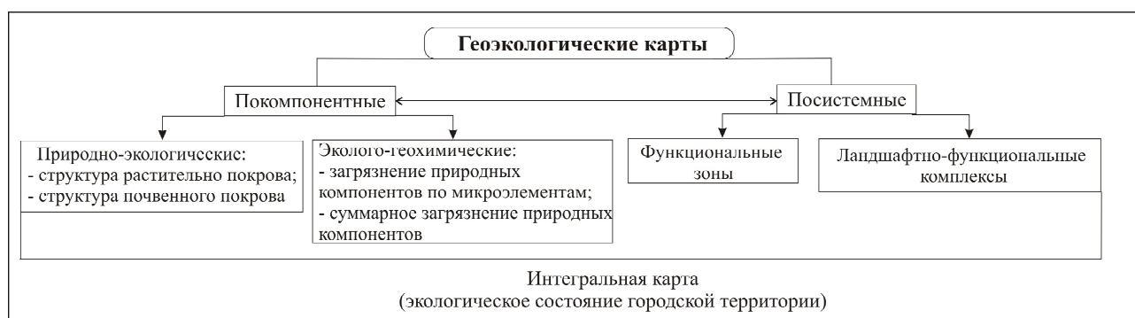
Рис. 2. Тематические составляющие интегральной карты, отражающей экологическое состояние городской среды

к которым относятся урбогеосистемы, прибегают к их содержательному расчленению. Здесь традиционно используется два основных пути их делимитации – покомпонентный и посистемный [1, 13].