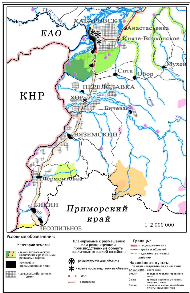
Рис. 1. Основные промышленные объекты, планируемые к размещению до 2025 г. в пределах южной части Хабаровского края

шихся энергетических и транспортных мощностей, которые, по всеобщему признанию, не удовлетворяют требованиям сегодняшних темпов и нуждаются в основательной модернизации. Основной антропогенный пресс ляжет на функционирующие промышленно-транспортные узлы – своеобразные «точки роста», существенным образом расширив их пространственных охват. «Расползание» промышленного производства на новые территории – явление вполне закономерное, признается неизбежным следствием процесса развития. В зоне влияния планируемых к размещению производств окажутся природные комплексы, выполнявшие ранее функции экологического регулирования. В данной ситуации очевидной задачей является предупреждающее выявление в пределах перспективных для развития территорий экологически значимых природных комплексов, в пределах которых необходимо обоснование определенных регламентов их использования, что позволит сохранить экологическое равновесие и возможность экономического развития. Экологическое равновесие обеспечивается за счет природных или природно-антропогенных комплексов, не включенных в процесс хозяйственного освоения территории. Выделение их предусматривает использование особого методического приема дифференциации территории – эколого-функционального зонирования.